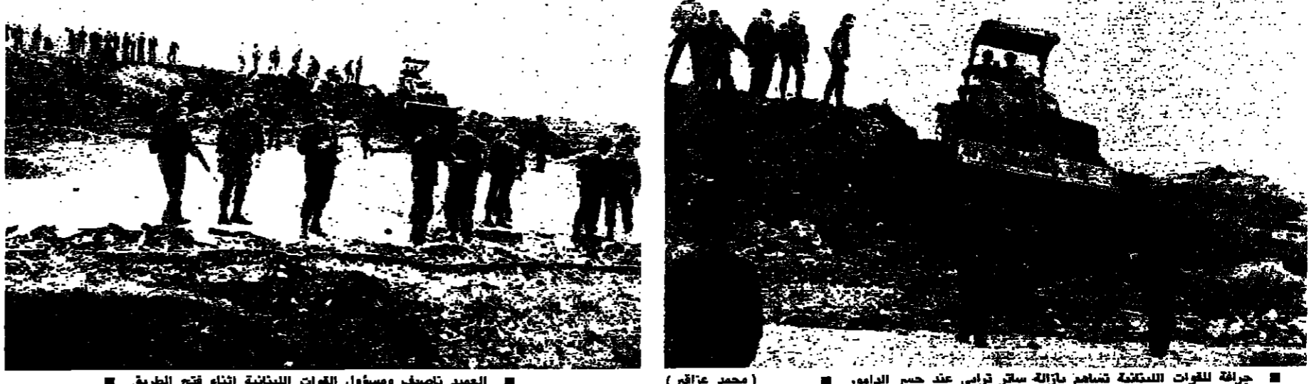
جرافة للفرقة اللبنانية تشغّل سائر ترابي عند جسر الدامور (محمد زغاري)